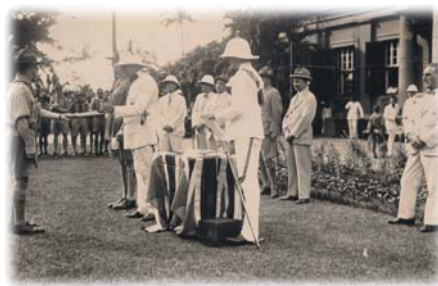
1930年總領袖在總督府內頒發童軍領袖委任證書 Presentation of Scouter Warrant by Chief Scout in Government House 1930