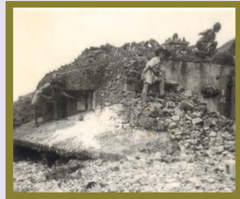
1948 年深水灣附近的戰時碉堡 WW II Pillbox near Deep Water Bay, 1948

也許 1952 年將香港劃分為兩區時，柯昭璋總監以黃泥涌峽道為中界線，將域多利亞區以東的一區定名為黃泥涌，以紀念黃泥涌峽一役。但這不過一廂情願的聯想，因至今仍未發現任何檔案文件談及黃泥涌區的定名，甚至那一輩的老童軍亦未有聽聞。