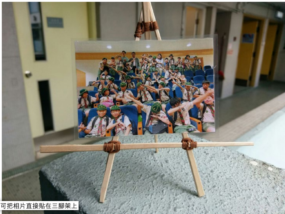
可把相片直接貼在三腳架上