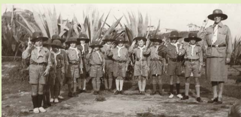
1920年代之山頂小狼團