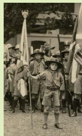
1925年香港第2旅的小狼