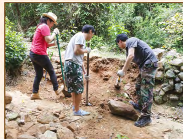
1. 在倒塌石牆挖出空間