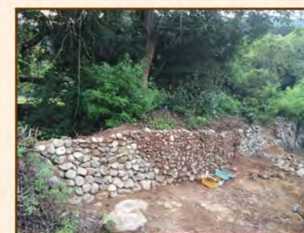
6. 重覆上述工序後完成