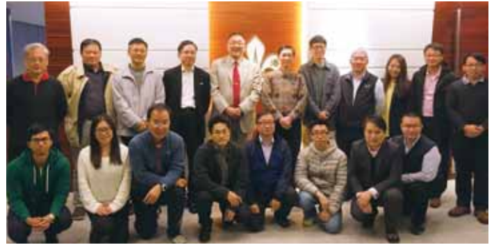
資訊及通訊科技委員會