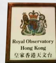
享有 85 年的榮銜