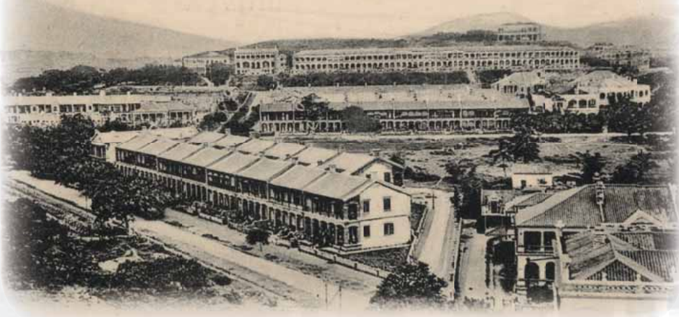
1906 年的天文台屹立丘上，環顧四野