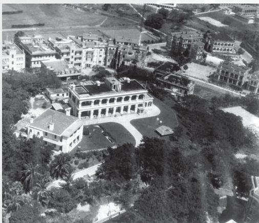
俯瞰 50 年代的天文台，圖中為 1883 大樓 (香港天文台網頁)

氣 象組經常向童軍兄弟姊妹解釋的，並非氣候、雲種或熱帶氣旋，而是氣象。那麼，氣象組的工作是推廣觀星，還是講解天氣？