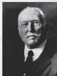
杜柏克博士