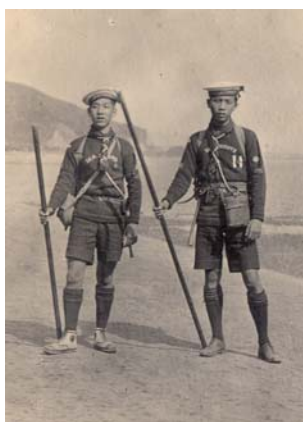
On Hike 1926 1926 年遠足

海童軍運動的誕生，可以追溯至 1909 年，剛好是《少年警探》(Scouting for Boys) 一書出版後的週年。那年 8 月，貝登堡舉辦了第 3 次露營，即 The Beaulieu River Scout Camp。一艘訓練船 The Mercury 號在營地附近靠泊，作為各種水上活動的基地，這也許是首次的海童軍露營，亦同時為海童軍的起源。海童軍這名詞到 1912 年才正式在「政策、組織及規條」(P. O.R.) 中出現。