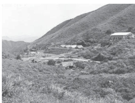
1960年代在香港基維爾營地之童軍露營 Scout Camping in Hong Kong Gilwell Campsite, 1960s