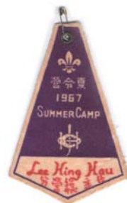
1967年夏令營營章 Camp Badge of 1967 Summer Camp

間之地區為比賽地點。該等負責評判的資深領袖，均欣賞該處之風景，亦因面積廣闊、水源充足，認為是理想的童軍營地，於是建議採用該地區為總會營地。至1955年，總會正式向大埔理民府申請使用該處，到1960年始獲批准。總會訂了「3年計劃」發展該處為童軍營地。