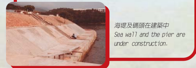
海堤及碼頭在建築中 Sea wall and the pier are under construction.