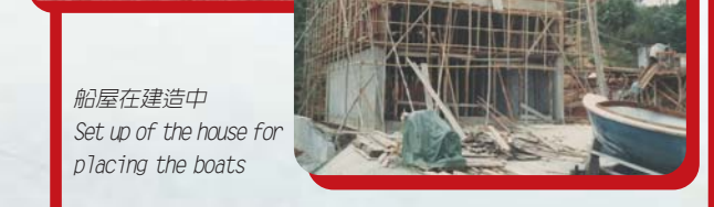
船屋在建造中 Set up of the house for placing the boats