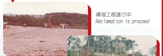
填海工程進行中 Reclamation is proceed