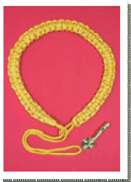
香港總監榮譽笛子