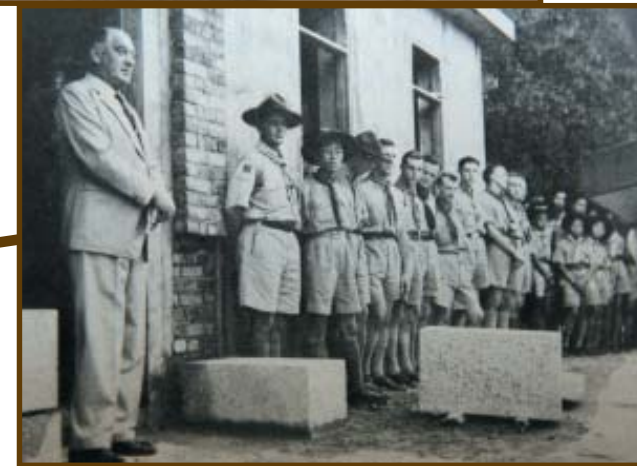
一塊土地作為童軍營地，即今日的大潭童軍營地。而柴灣童軍營地即今日柴灣公園舊址。

大潭童軍營地於1972年9月開放啟用的，位於香港島東南面，石澳與龜背灣之間的（即現時的大潭童軍中心）。